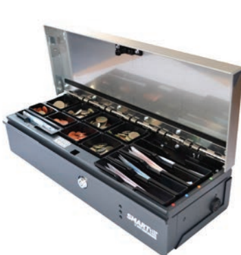
Modelo SMARTtill (Versión 5 billetteros)