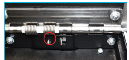
La pestaña de rápida liberación permite extraer fácilmente La unidad SMARTtill de la placa base